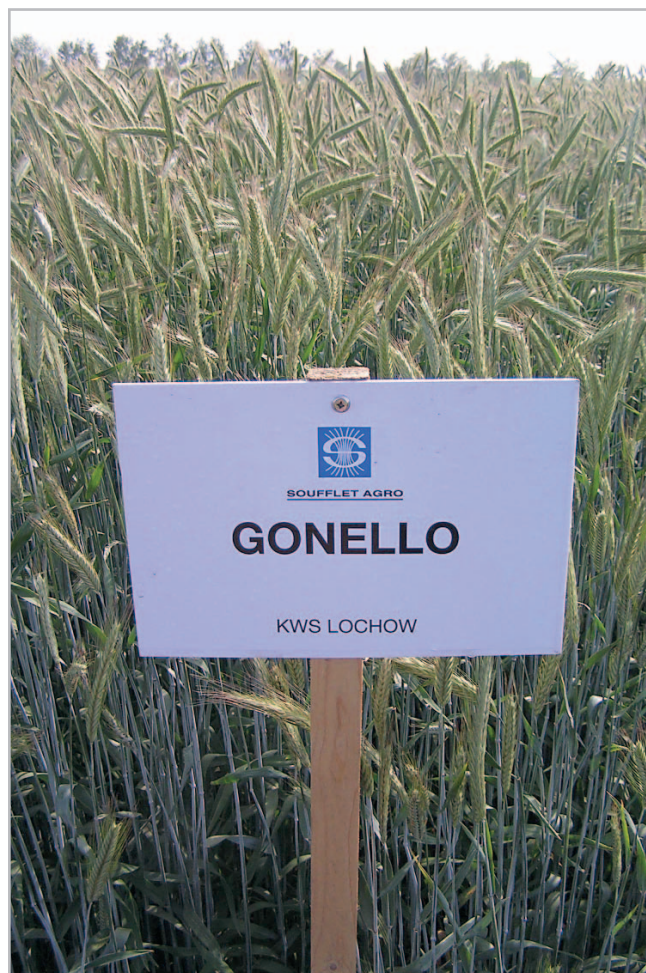
Hybrid Gonello s technologií Pollen Plus byl nejvýnosnější v testování ÚKZÚZ v letech 2008 až 2010