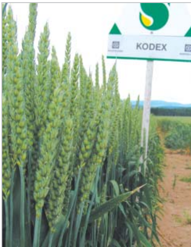
Kodex (C) je loňská, vysoce výnosná novinka