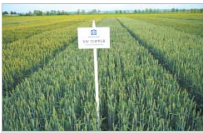
Jistotu ve kvalitě přináší pěstitelům odrůda SW Topper (E)