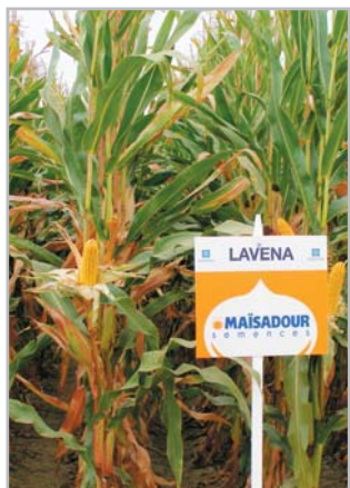
Hybrid Lavena nabízený pod obchodní značkou Maisadour je vhodný k využití na zrno, siláž i k výrobě bioplynu