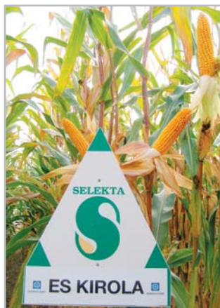
Novinkou pro rok 2009 je hybrid ES Kírola, nabízený pod značkou Selekt. Je určen pro pěstování na siláž do vyšších oblastí