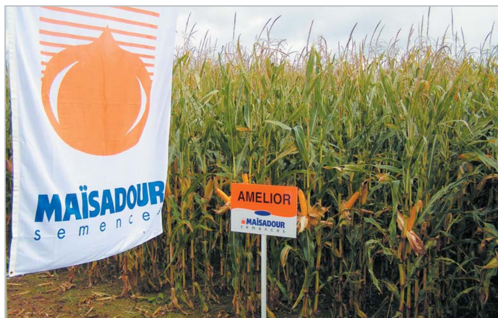
Hybrid kukuřice Amelior využívá Ústřední kontrolní a zkušební ústav zemědělský jako kontrolu v raném sortimentu na zrno