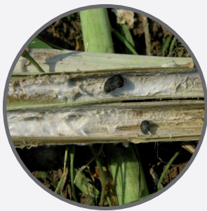
Řepka – hlízenka