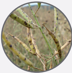
Řepka – alternaria