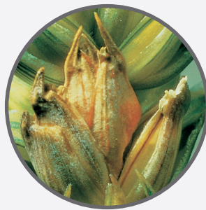
Pšenice – klasové choroby